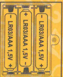
Az elemek megfelelő behelyezése

Figyelni! 36 hónapig tartó felhasználás után a termékben található elemeket a hulladékgyűjtő rendszerben kezelni kell. A termékben található elemeket a hulladékgyűjtő rendszerben kezelni kell.